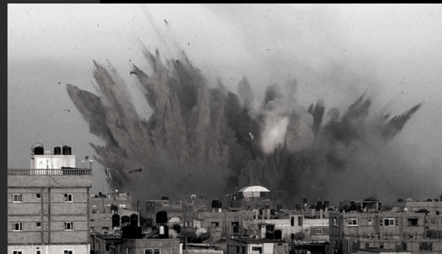
-SE COMPLETAN 20 ATAQUES EN 2020 POR PARTE DE EE.UU.-