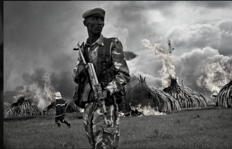
-QUEMA DE MARFIL-