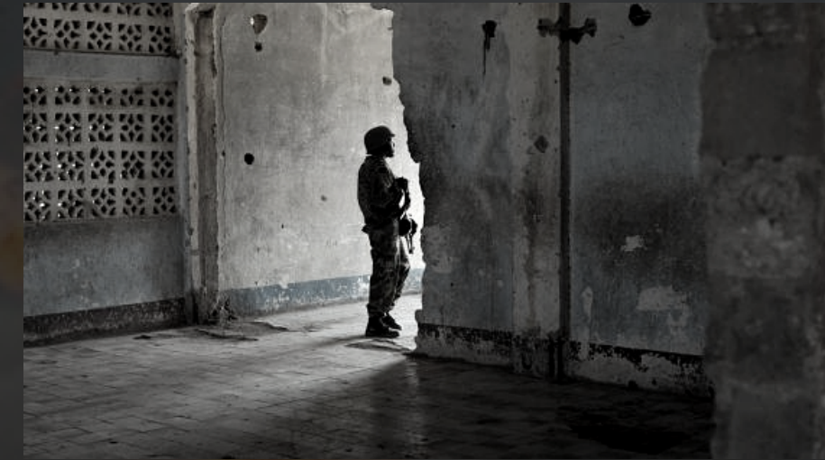
-DESTRUCCIÓN DE INFRAESTRUCTURA-