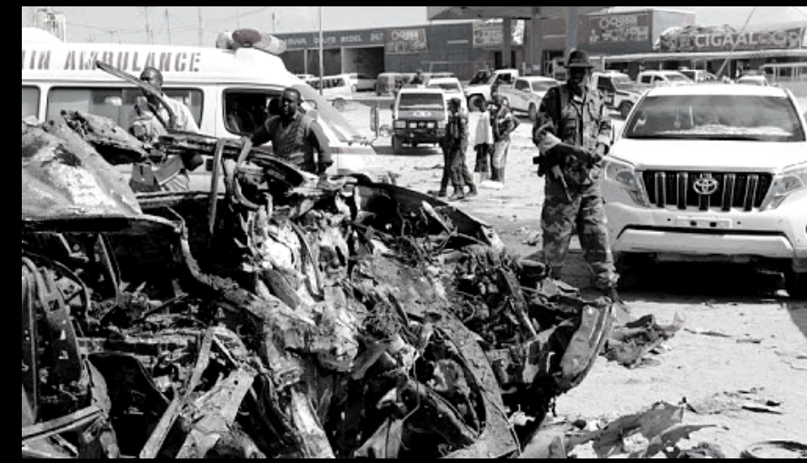
-ATAQUE A BASE MILITAR ESTADOUNIDENSE EN LAMU-