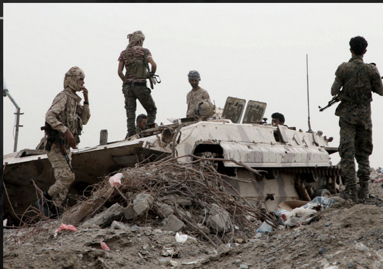
-GOLPE DE ESTADO 2014-