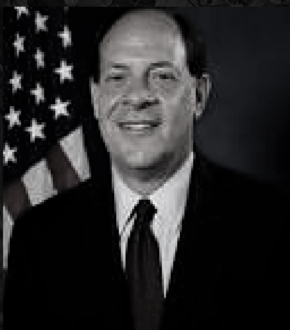
-GARANTIZAR EL NO DAÑO A LOS INTERESES ESTADOUNIDENSES-