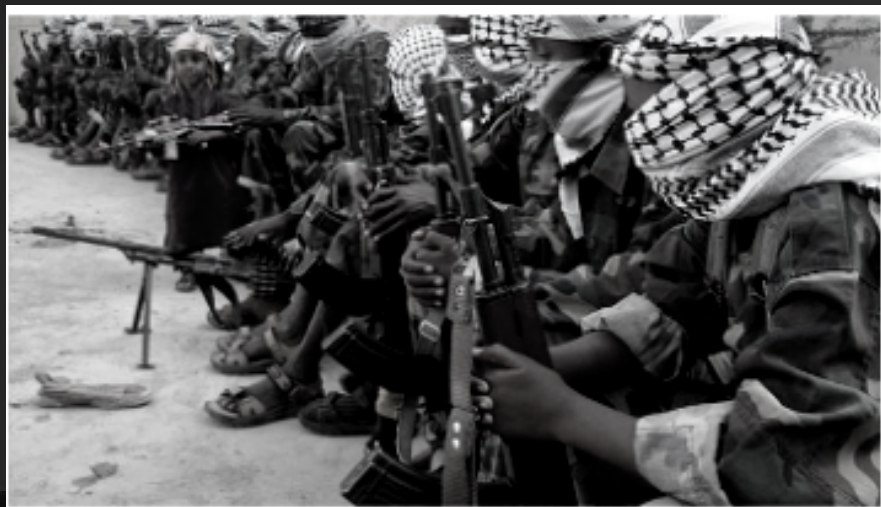
-AL SHABAB, CÉLULA DE AL QAEDA-